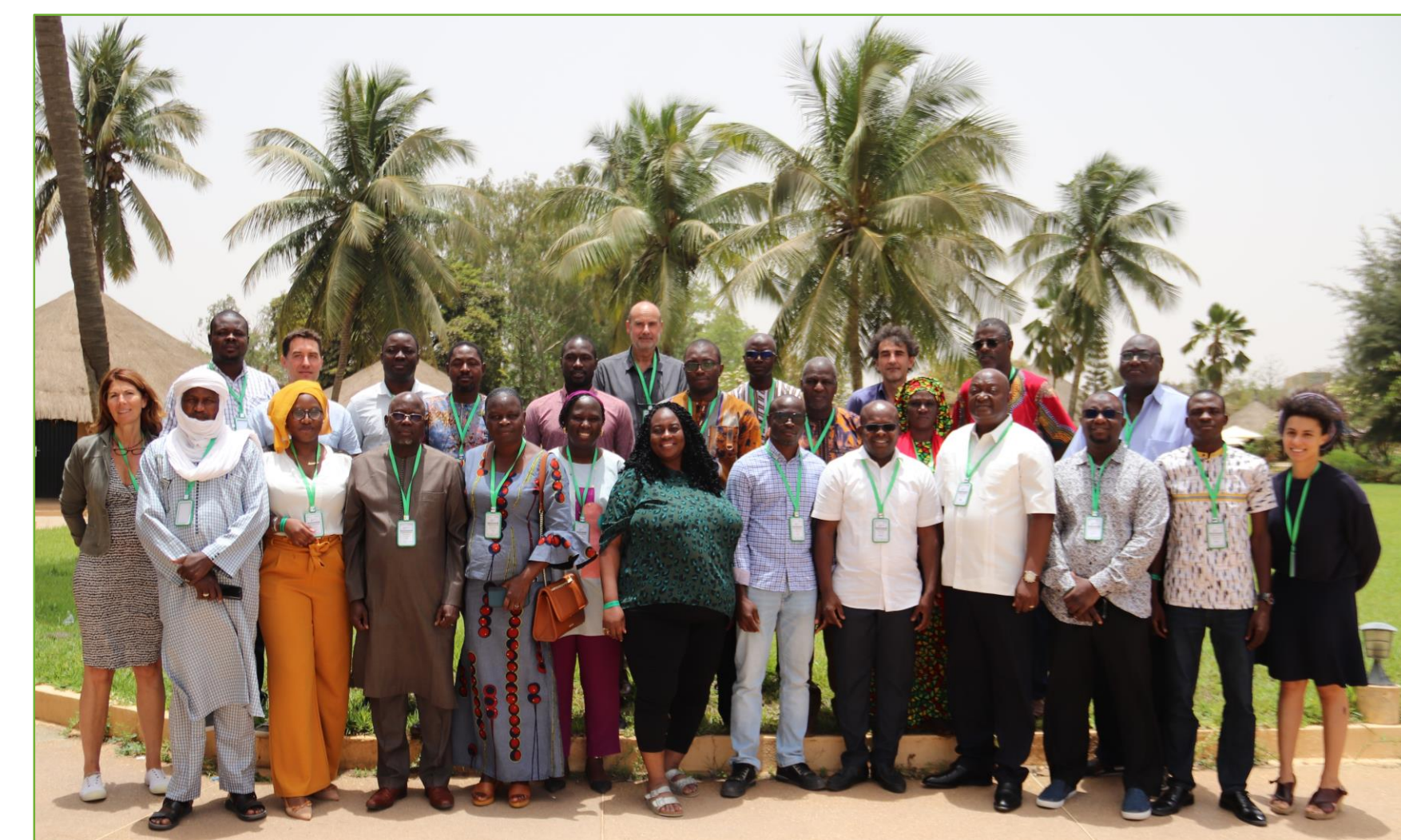
Photo de famille de l'atelier régional d'échange (avec banderole) - Saly Hôtel, Mbour, Sénégal, mai 2022