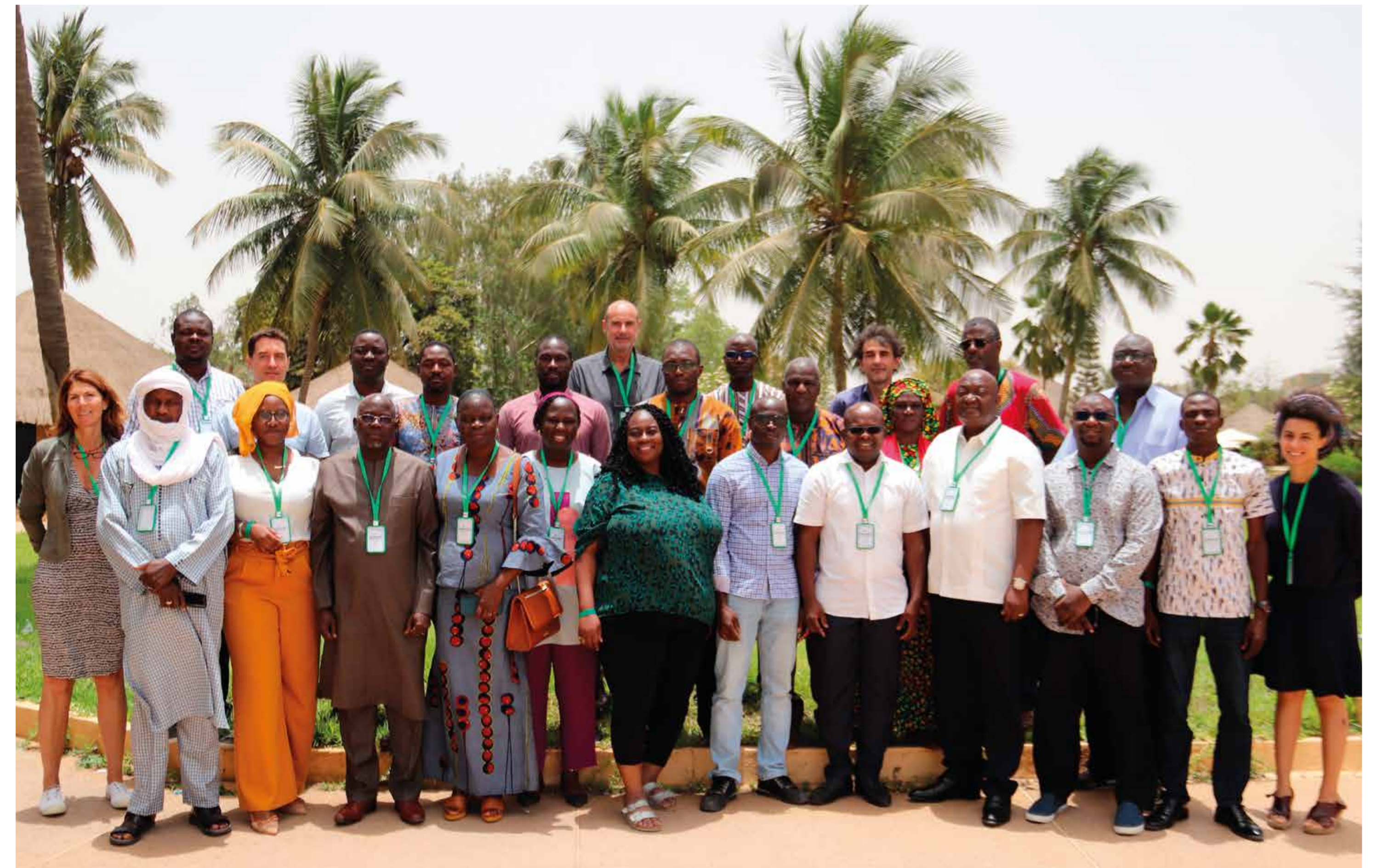
Photo de famille de l'atelier régional d'échange - Saly Hôtel, Mbour, Sénégal, mai 2022