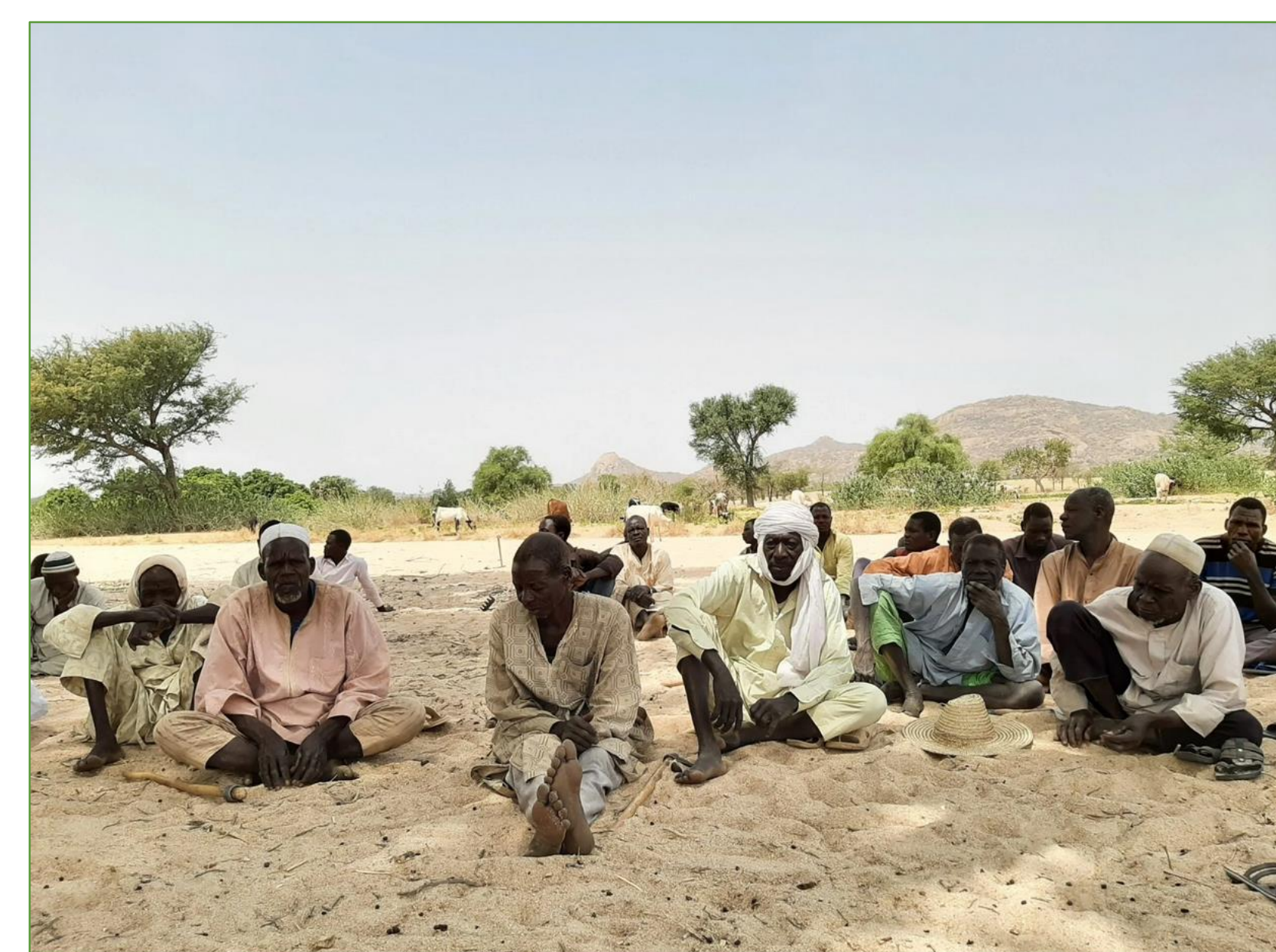
Focus group de pré-identification de sites de barrage souterrain dans le Guera (Tchad), 2021